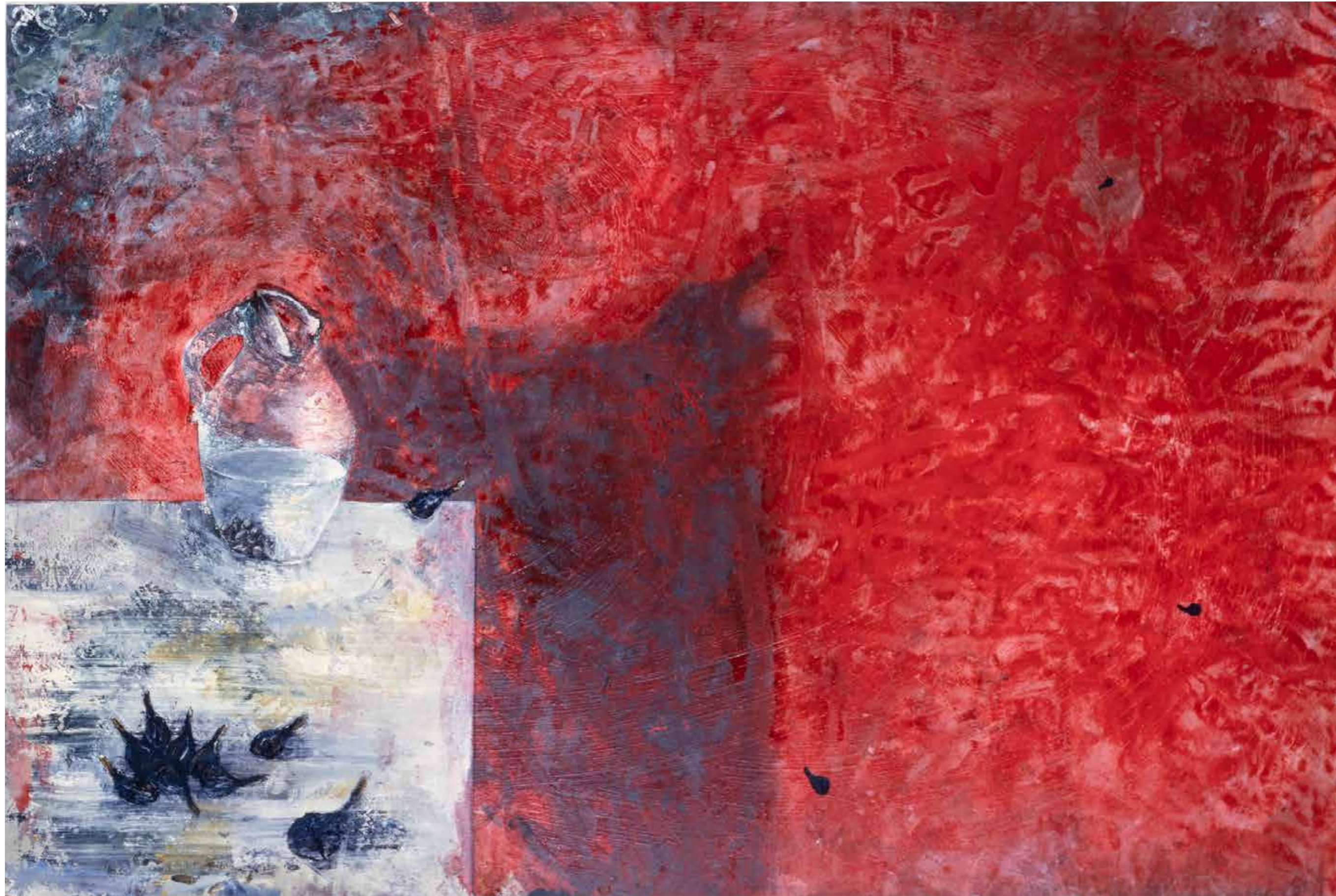
L'Eau et les figes , 1986 Technique mixte sur toile, 200 × 300 cm Collection Fondation Cartier pour l'art contemporain