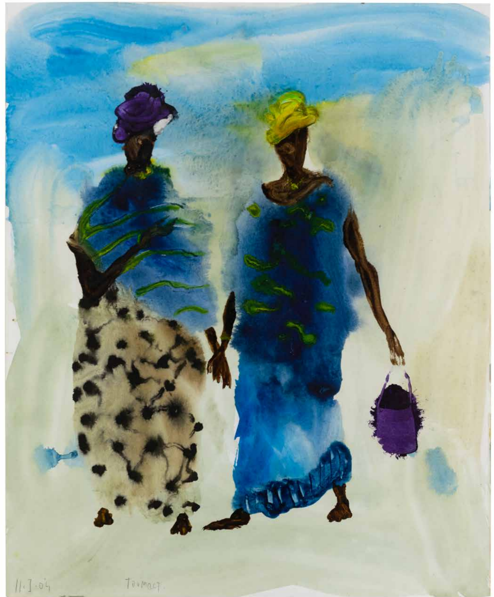
Cousines , 2004 Aquarelle sur papier, 63,5 × 52 cm Collection particulière