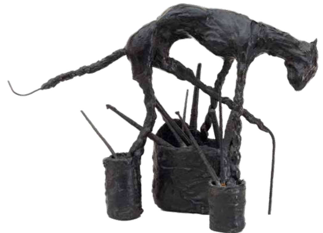
Miquel Barceló, date

Artiste voyageur, explorateur et connaisseur, Miquel Barceló (1957, Majorque) œuvre depuis plus de cinquante ans. La figure humaine, la faune, la flore, le paysage prennent sous ses mains d'artiste-artisan (pinceau, scie, couteau, racloir...) la forme d'apparitions, d'hybrides, de bestiaires et d'herbiers merveilleux. Inspiré de sa terre natale, nourri de rencontres, avide de littérature, son imaginaire déploie une mythologie personnelle féconde et un riche vocabulaire plastique. Expérimentant pigments, vernis, argiles, outils de travail, l'artiste réinvente de manière constante l'acte de créer. À travers ses peintures, sculptures, dessins, gravures, céramiques, cet ouvrage polyphonique où littérature, philosophie et histoire de l'art s'entrecroisent, invite à explorer l'univers d'un des artistes les plus importants de l'époque contemporaine.