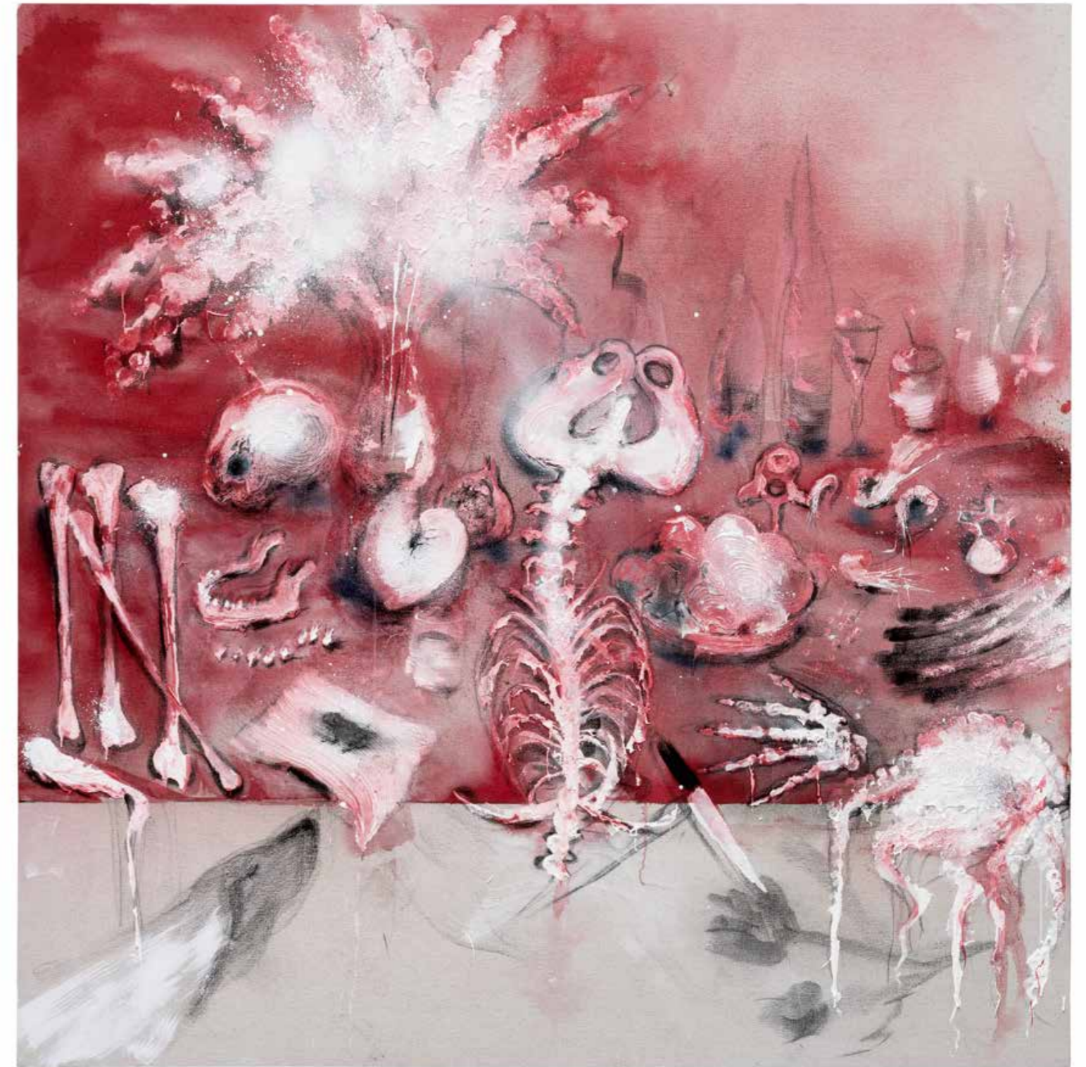
La Petite Bête, 2021 Technique mixte sur toile, 235 × 235 cm Collection particulière