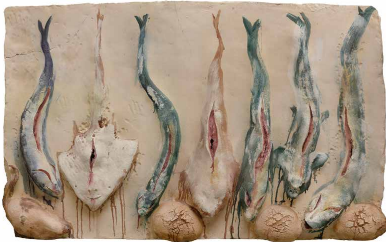
7 Peixos, Pans i Cap de Boc, 2003 Terre cuite, 128 × 212 × 15 cm Collection de l'artiste