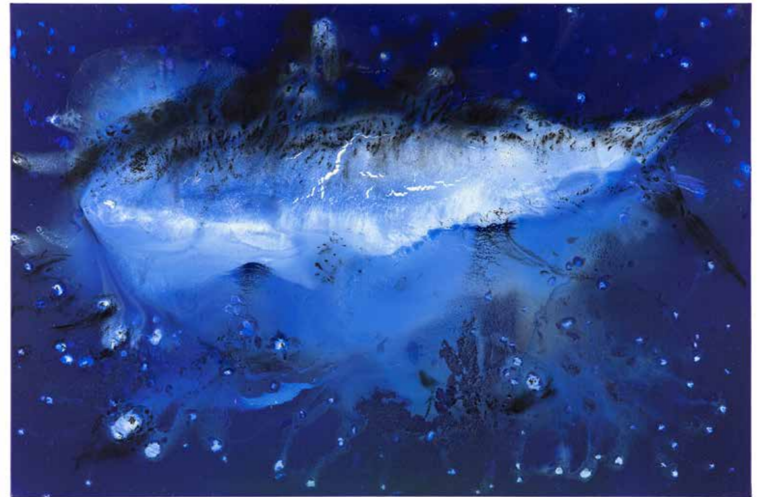
Gran Thunnus , 2015 Technique mixte sur toile, 160 × 240 × 3 cm Collection particulière

L'espace à la fois aérien et aquatique dans lequel nagent des mollusques ou des poissons, qui domine cette période, trouve une version monumentale dans la grande peinture immersive que Barceló exécute en 2016 pour la Fondation Carmignac, sur l'île de Porquerolles. Le milieu aquatique fut donc une source d'inspiration qui rejoignait ses propres thèmes. Miquel Barceló a peint spécialement pour la chapelle un immense panorama de 16 mètres de long, présenté en plusieurs panneaux, montrant sur un fond bleu ciel de vastes céphalopodes flottant dans cet aquarium pictural. Le spectateur est quasiment plongé dans la vision de ces eaux profondes, mystérieuses, grâce à l'alchimie de la peinture. Miquel Barceló fait également une grande sculpture en bronze, l' Alycastre (2018), emblème du lieu placé à l'entrée.