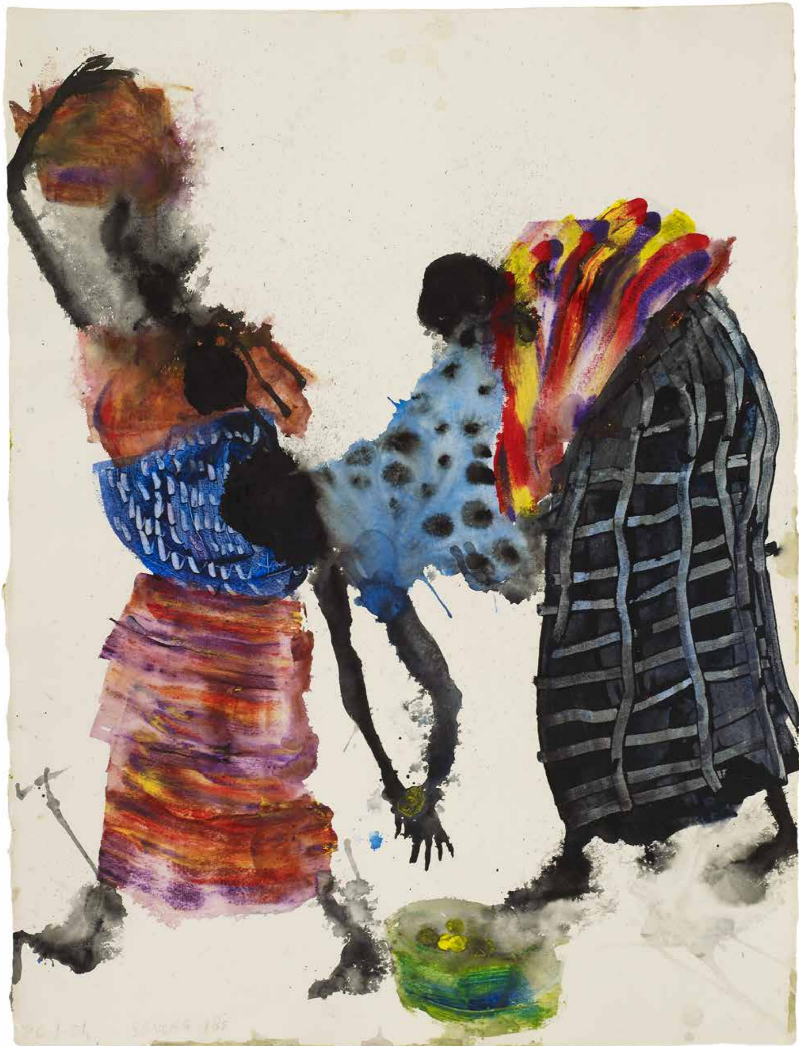
Jeune mère avec la jupe à carreaux , 2004 Aquarelle sur papier, 77 × 59 cm Collection particulière