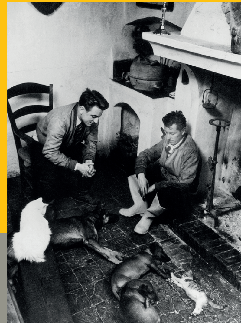
Dmitri Kessel, Pierre Bergé et Bernard Buffet dans leur maison de Nanse, 1955

Coédition avec Connaissances des Arts 23 x 28 cm relié plein tissu 192 pages, 100 ill. couleur ISBN : 978 2 85088 683 6 Parution : 12 octobre 2016 Prix : 59 €