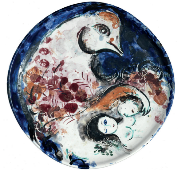
Marc Chagall, Pour Vava ou Le Coq, 1954 Céramique, 31 x 3,5 cm Collection particulière