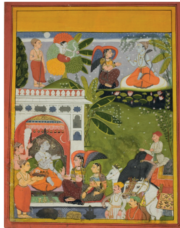
École indienne, Mewar (Rajasthan), Kama décochant une flèche d'amour sur Shiva (page du Gita-Gauri), vers 1670-1685 Gouache et or sur papier, 23,2 x 19,7 cm Chicago, The Art Institute

En s'intéressant à des œuvres relevant de cette thématique, de différentes cultures et de différentes époques, des plus anciennes aux plus contemporaines, et dans lesquelles l'amour se déploie au sein d'une nature non pas décorative, mais active, le livre propose d'investiguer une essence (ou vocation) possible de l'amour dans laquelle la relation interhumaine s'élargit et intègre la nature en tant que partenaire à part entière.