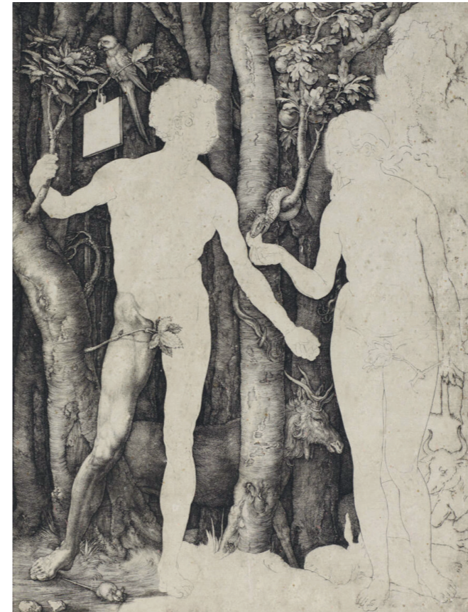
Albrecht Dürer, Adam et Ève, 1504 Gravure sur cuivre (épreuve préparatoire), 25,6 x 19,4 cm Vienne, Albertina