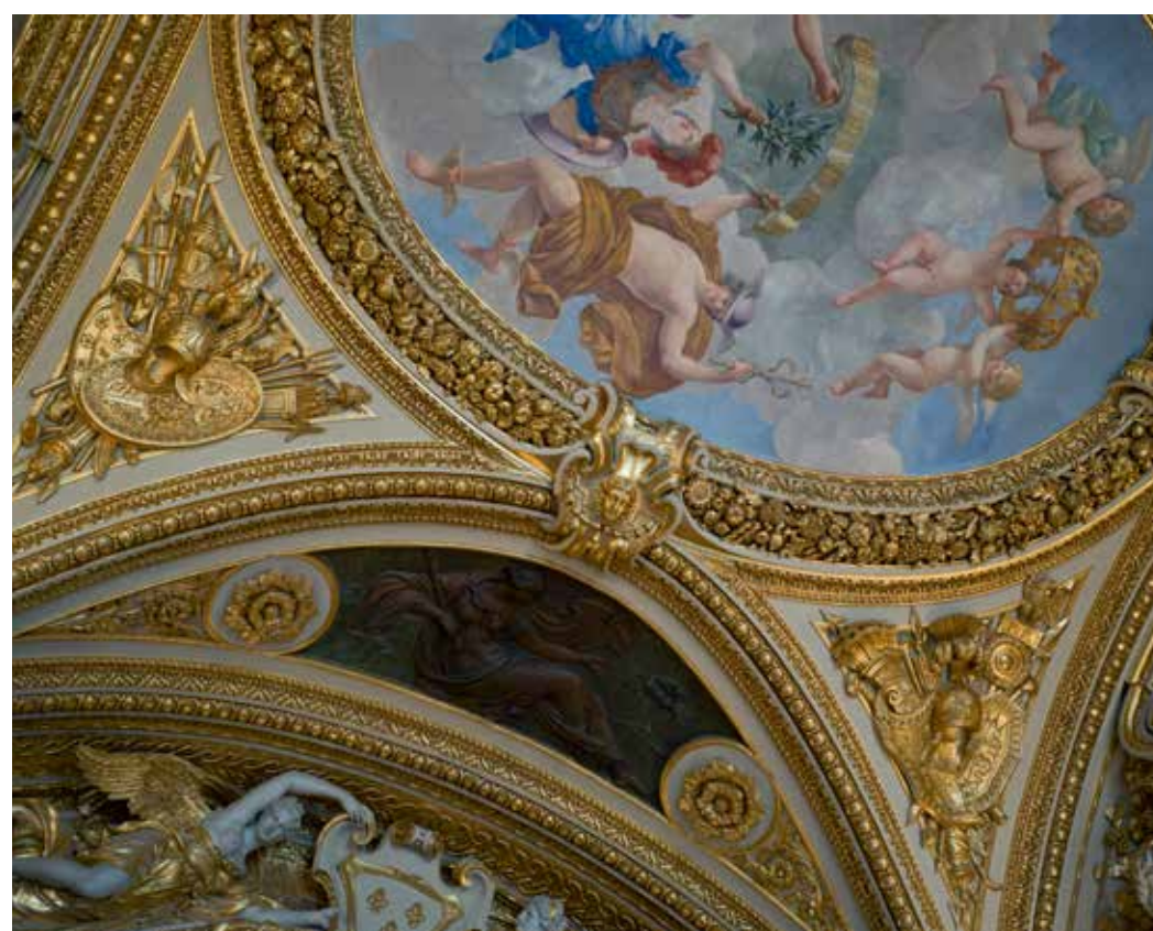
Giovan Francesco Romanelli, Michel Anguier, Pietro Sasso, plafond du salon de la Paix dans les appartements d'Anne d'Autriche, XVII e siècle

Auteur de nombreux ouvrages sur le voyage, les traces de la guerre, le patrimoine européen ou l'univers des peintres contemporains, Gérard Rondeau († 2016) a constitué un œuvre rare et singulier. Il a notamment signé Les Fantômes du Chemin des dames (Seuil, 2003), Hors Cadre (RMN, 2005), La Cathédrale de Reims , texte d'Auguste Rodin (RMN, 2011) et Quai Branly – là où soufflent les esprits (Quai Branly/La Martinière, 2012).