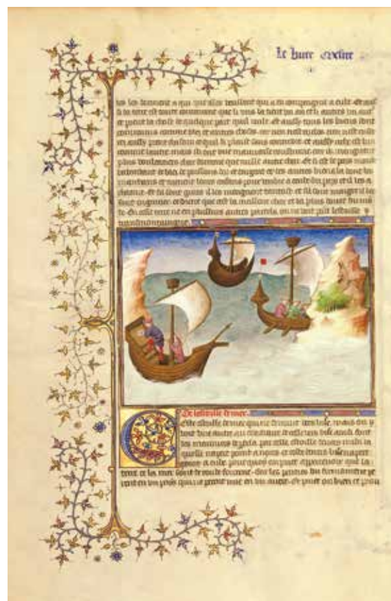
Fol. 188v°: On peut faire le tour de la Terre