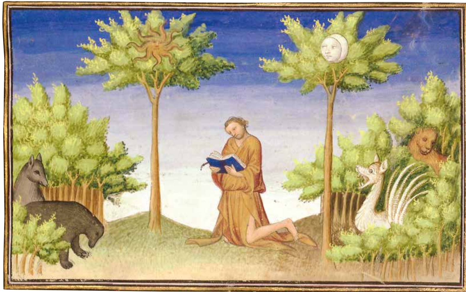
Fol. 220r°: Les arbres du Soleil et de la Lune