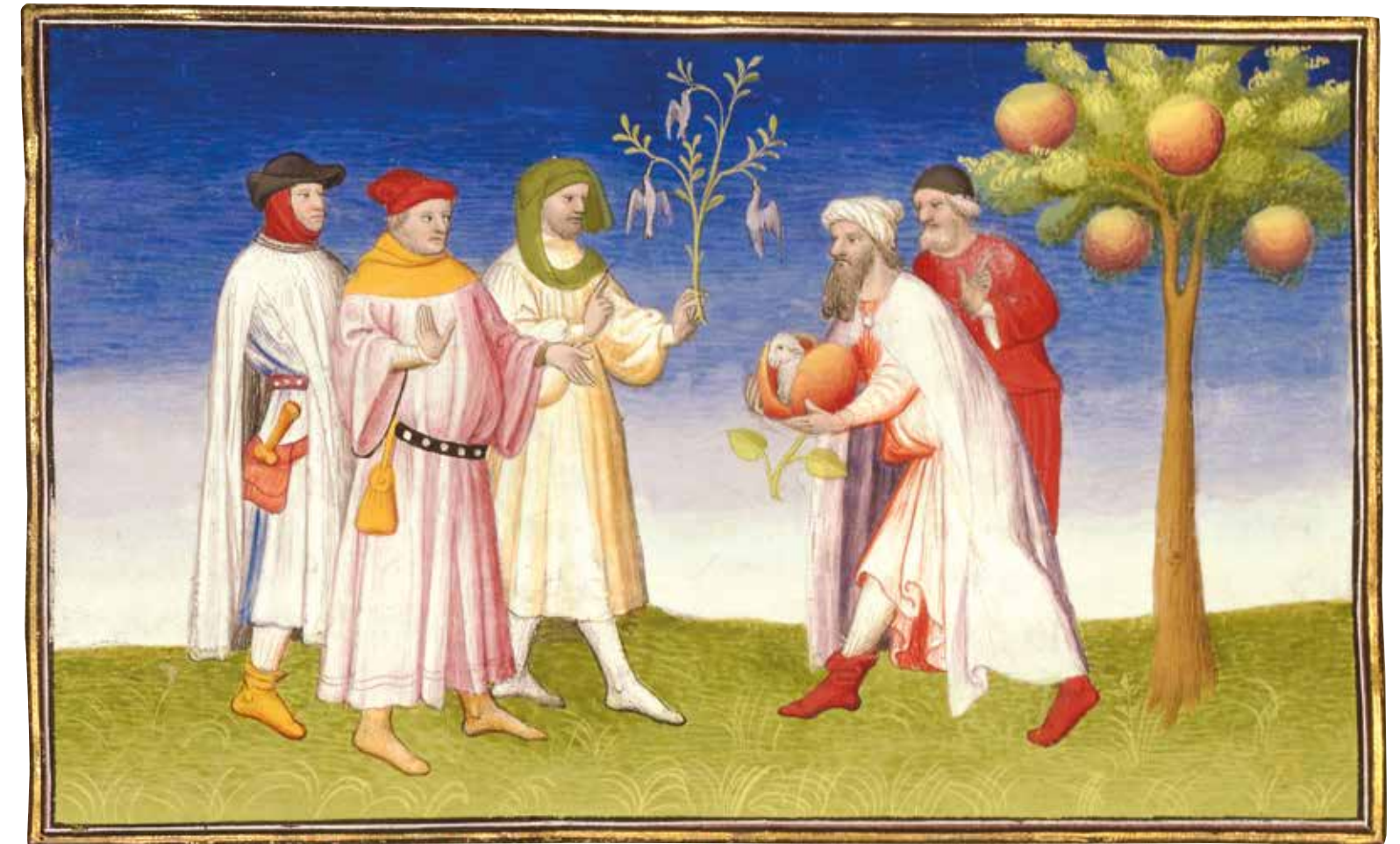
Fol. 210v°: Les fruits étranges de Cadilhe