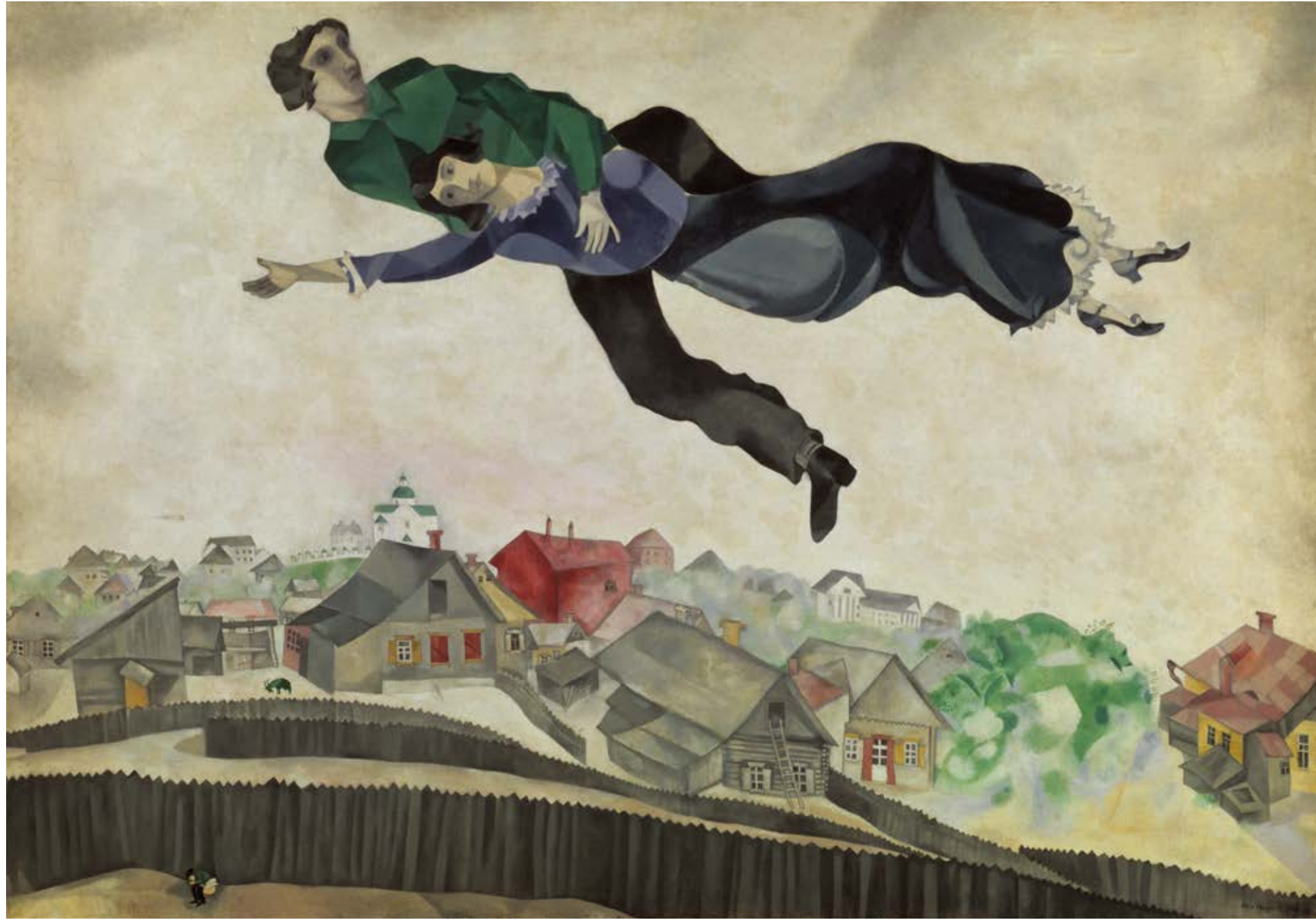
Au-dessus de la ville 1914-1918 Huile sur toile, 141 x 198 cm Moscou, Galerie Tretiakov