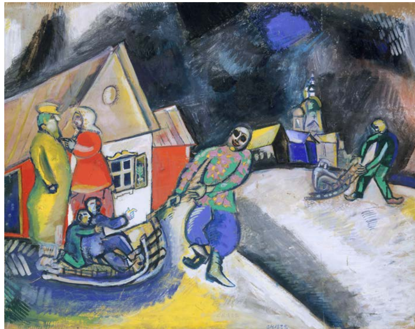
Neige, hiver à Vitebsk

s'installe définitivement en 1950. Dans une salle du rez-de-chaussée, une toile immense (296 × 406 cm), qui résume l'œuvre entier de l'artiste, accueille le visiteur. De fait, plus qu'un simple tableau, La Vie (1964) est pratiquement un abécédaire de l'univers chagallien, un rendez-vous avec la quasi-totalité de ses personnages et de ses thèmes iconographiques récurrents. Disséminées sur toute la surface, ce sont de petites saynètes, déjà rencontrées dans d'autres toiles du maître. Aucun récit ne réunit cet ensemble éclaté, cette polyphonie visuelle, comme souvent dans la peinture chagallienne. Entassés dans le même espace, lieux – Paris, Vitebsk, la ville natale de l'artiste – et bribes d'histoire sont indépendants les uns des autres, échappant à toute chronologie linéaire. Cette habitude de rebondir d'un lieu à l'autre, de créer des rapprochements entre des personnages et des situations éparses, de disperser plusieurs centres de gravité dans la même toile traduit la démarche de Chagall. Sa peinture, comme le rêve, ignore les contradictions. Jean-Michel Foray écrit à son propos : « Cette œuvre [est] allégorique de son illisibilité fondamentale, de son absence de parti pris esthétique; la surface du tableau