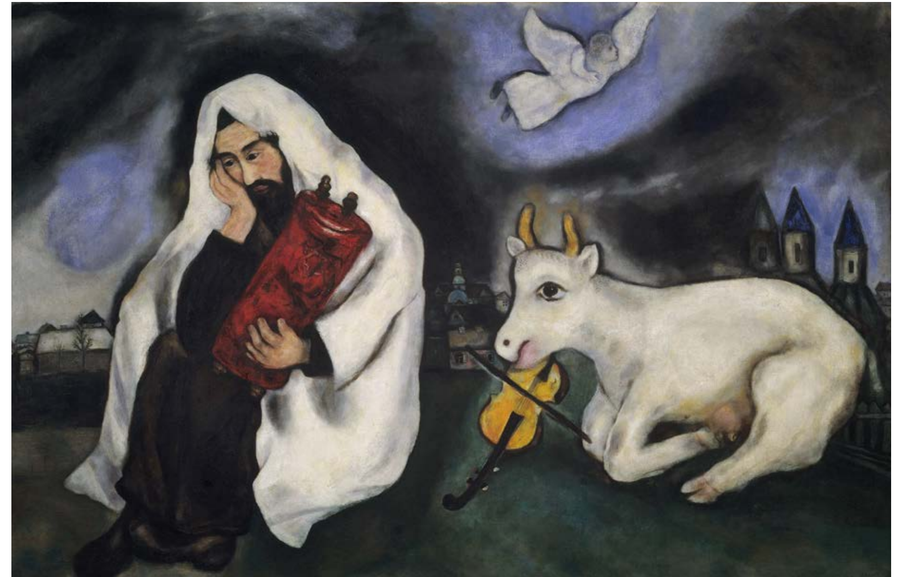
Solitude 1933 Huile sur toile, 102 x 169 cm Tel Aviv, Tel Aviv Museum of Art

Chagall, écrit Gilbert Lascault, « préfère toujours le détour à la ligne droite, le prodige à la banalité, les sauts aux explications lentes, la simplicité aux mouvements oratoires, les flottements subtils aux affirmations péremptives ». Son œuvre, qui se permet toutes les digressions, est mi-fiction, mi-imitation du monde réel, mi-respectueuse, mi-impertinente. L'artiste se maintient dans la position difficilement soutenable de l'entre-deux. Entre provincial et cosmopolite, entre juif et non juif, entre russe