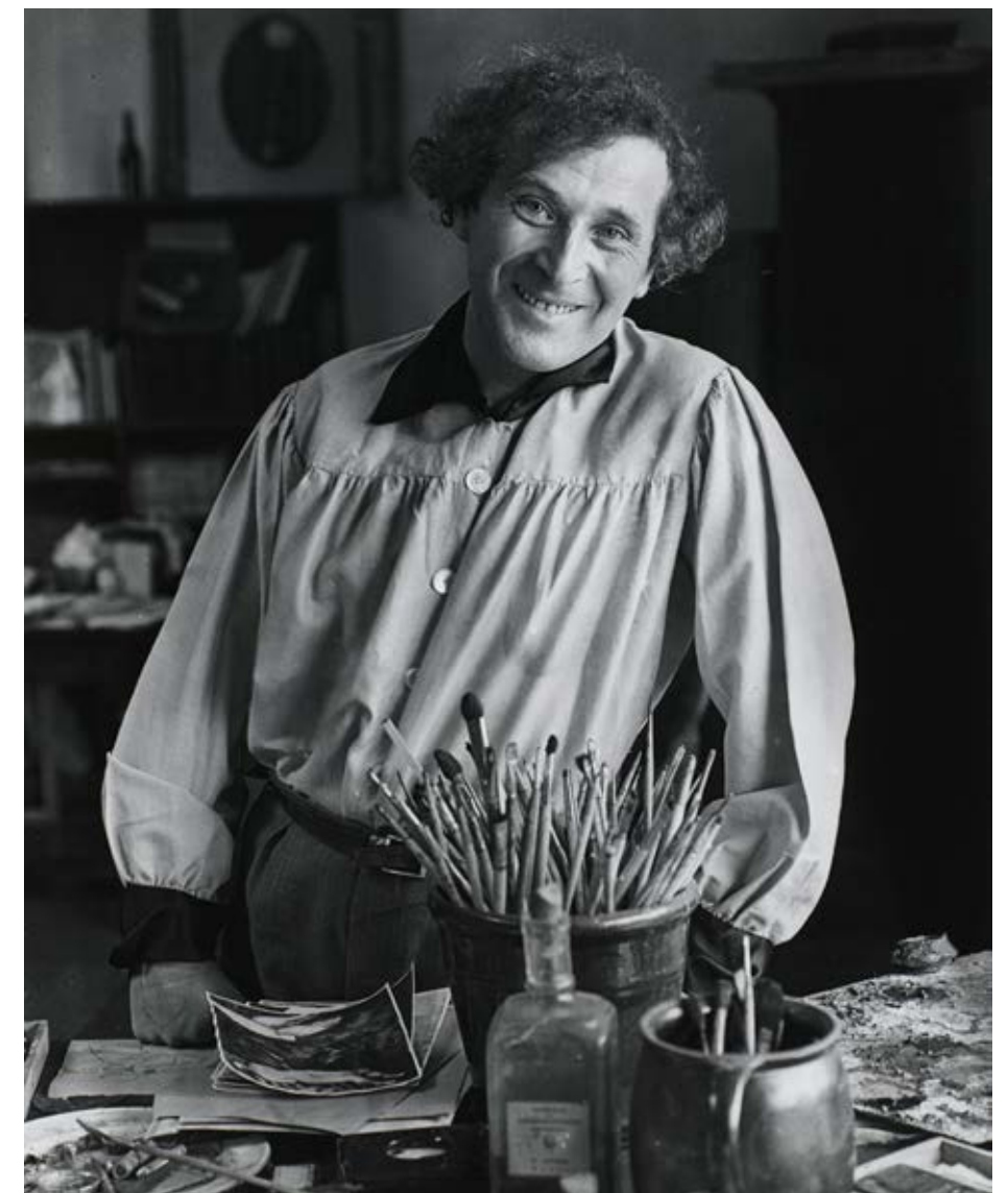
André Kertész Chagall 1933 Photographie Paris, Centre Pompidou – Musée national d'art moderne