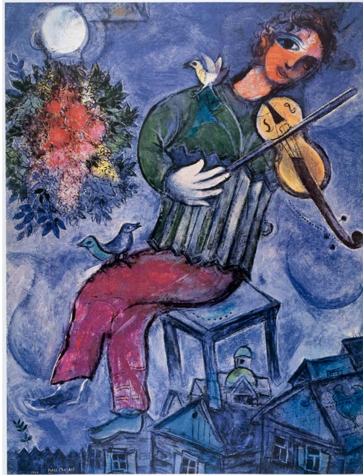
La Danse 1950 Huile sur toile, 238 x 176 cm Nice, musée national Marc Chagall, dépôt du Centre Pompidou

l'émigré, déplacé géographiquement et historiquement, déphasé par rapport à ce qu'on attend d'un artiste moderne. [Il a] un pied dans l'histoire de l'art et un pied hors cadre, à contre-courant des avant-gardes». Son œuvre, délibérément en marge, est irréductible aux théories de l'art. Inclassable, il fut déclassé. Volontairement ou non, Chagall s'est mis à l'écart. Ce qui fait sa force.