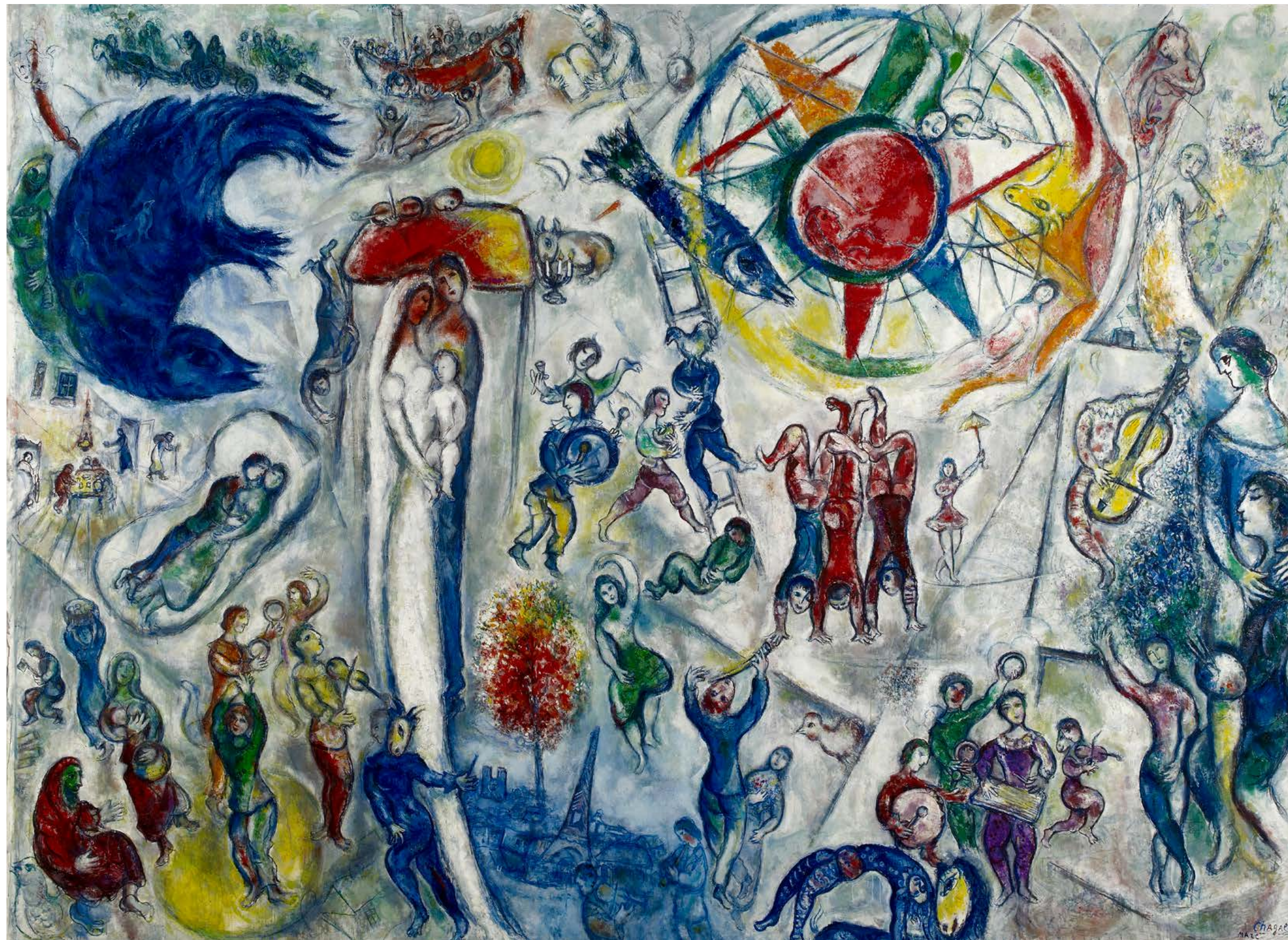
La Vie 1964 Huile sur toile, 296 x 406 cm Saint-Paul-de-Vence, Fondation Marguerite et Aimé Maeght