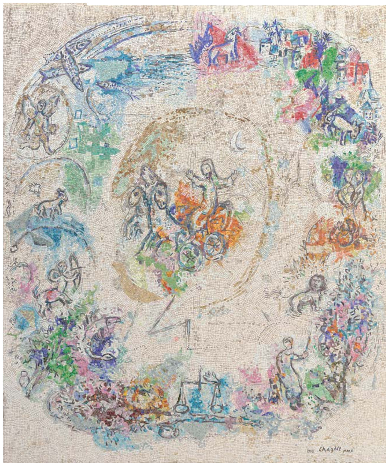
Le Prophète Élie 1971 Mosaïque, 715 x 570 cm Nice, Jardin du musée national Marc Chagall, dépôt du FNAC