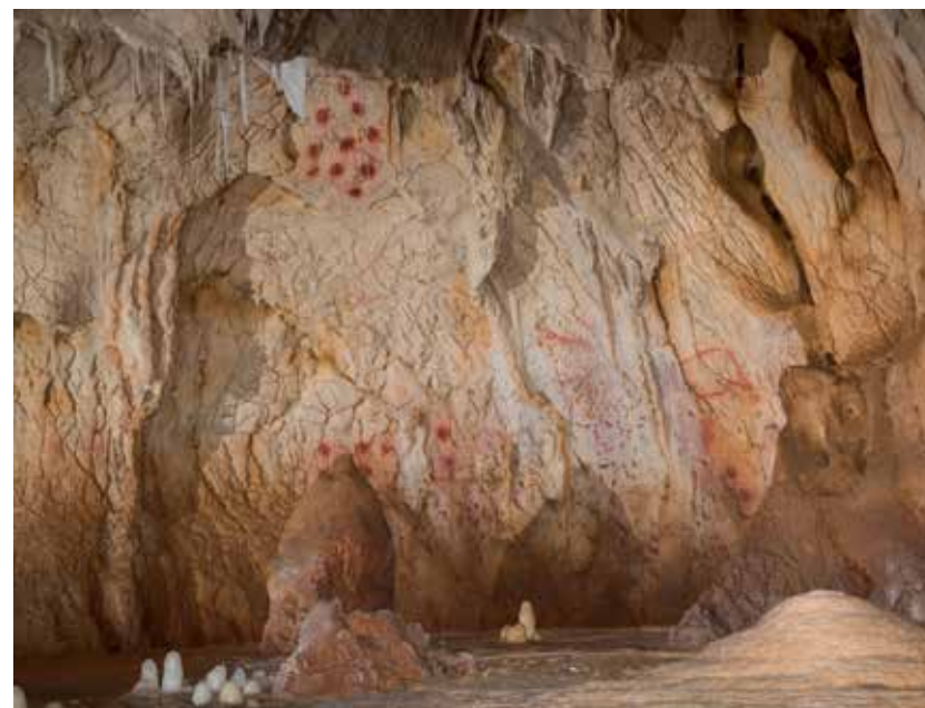
Galerie des Panneaux rouges

Des données scientifiques (datation, topographie, relevés, modélisation 3D...) à l'interprétation anthropologique, cette étude actualisée offre au lecteur une immersion passionnante dans le monde paléolithique.