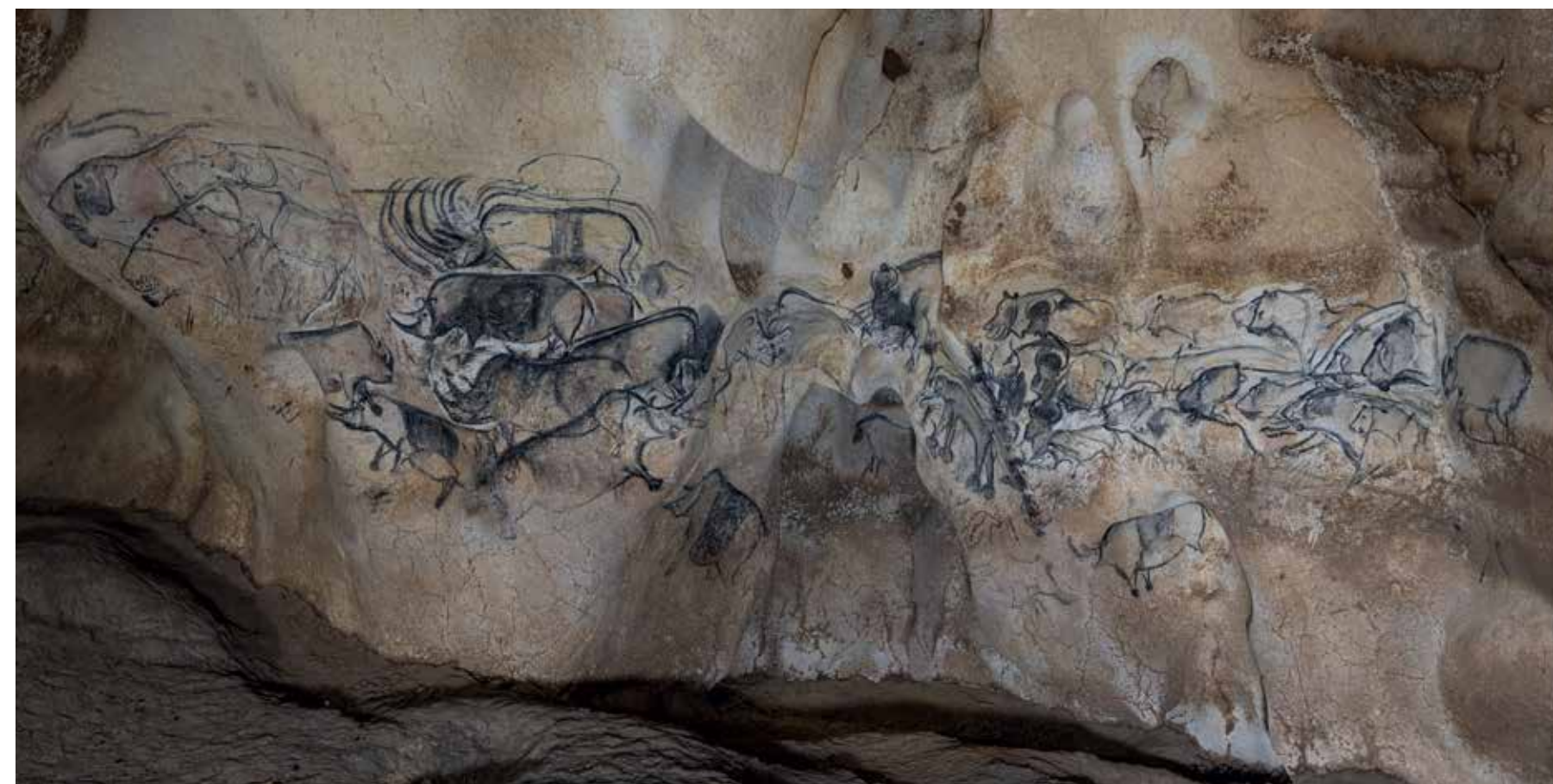
En haut à gauche Ours et panthère, salle des Bauges