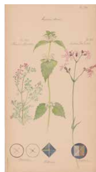
FOLIO 46 Lamium album (Lamier blanc ou ortie blanche), 16 juin 1920 Lychnis flos cuculi [Silene flos-cuculi] (Lychnis ou silène fleur-de-coucou), 17 juin 1920 Fumaria officinalis (Fumeterre officinale), 18 juin 1920 Aquarelle, crayon, encre et peinture métallique sur papier 50 × 27 cm