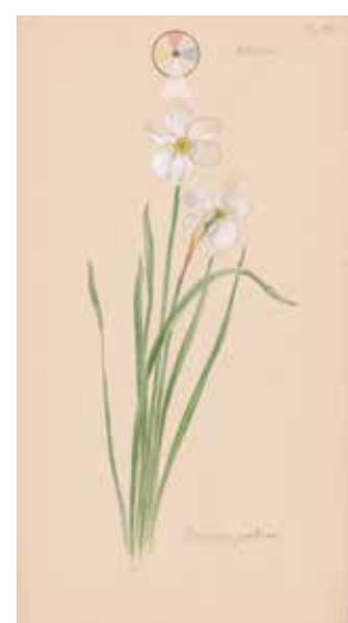
FOLIO 34 Narcissus poeticus (Narcisse des poètes), 19 mai 1920 Aquarelle, crayon, encre, gouache et peinture métallique sur papier 49,6 × 27 cm