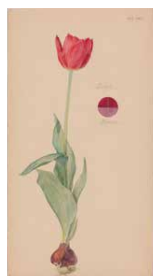
FOLIO 35 Tulipa [Tulipa sp.] (Tulipe), 20 mai 1920 Aquarelle, crayon, encre et peinture métallique sur papier 49,8 × 27 cm