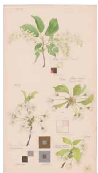
FOLIO 7 Prunus padus (Cerisier à grappes), 27 mai 1919 Prunus avium (Merisier ou cerisier des oiseaux), 28 mai 1919 Prunus cerasus (Cerisier acide ou griottier), 28 mai 1919 Prunus domestica (Prunier domestique), 3 juin 1919 Aquarelle, crayon, encre et peinture métallique sur papier 49,9 × 27 cm