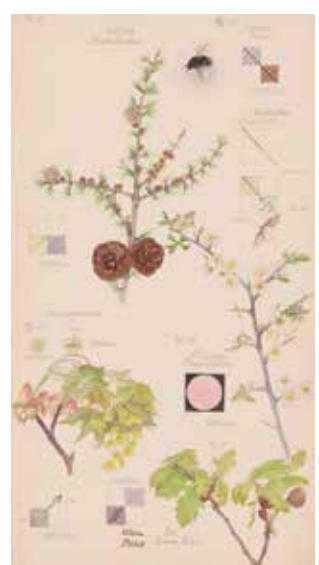
FOLIO 6 Larix decidua (Mélèze commun), 20 mai 1919 Lepidoptera [Perizoma sp.] (Périsome), 23 mai 1919 Prunus spinosa (Prunellier), 23 mai 1919 Acer platanoides (Érable plane), 25 mai 1919 Quercus robur (Chêne pédonculé), 26 mai 1919 Bombus [Bombus lapidarius] (Bourdon des pierres), 27 mai 1919 Aquarelle, crayon, encre et peinture métallique sur papier 49,9 × 26,9 cm