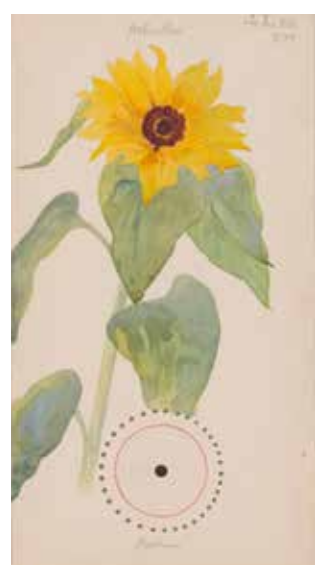
FOLIO 27 Helianthus [Helianthus annuus] (Tournesol), 3 septembre 1919 Aquarelle, crayon, encre et peinture métallique sur papier 50,2 × 26,8 cm