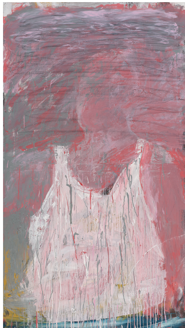
Alexej von Jawlensky Tête abstraite - Aube Août 1928 Paris, Centre Pompidou - musée national d'Art moderne