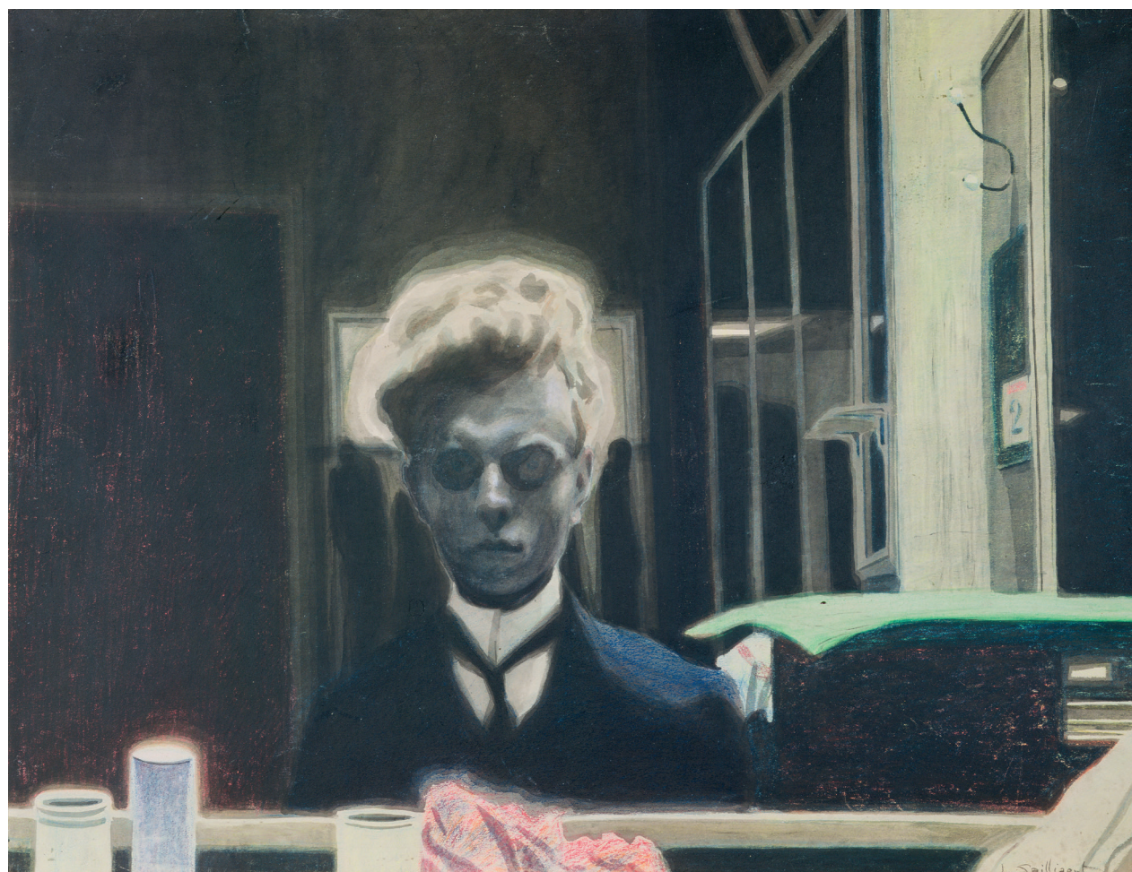
Léon Spilliaert Autoportrait (2 novembre) 1907 Bruges, collection De Keyser