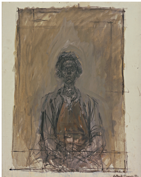
Alberto Giacometti Annette 1962 New York, Museum of Modern Art